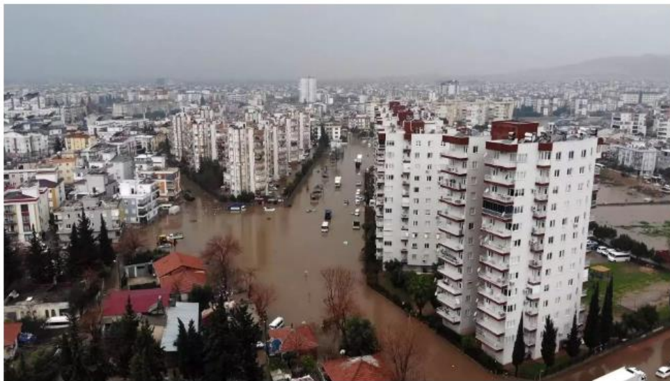
圖 2、土耳其安塔莉亞市淹水照片