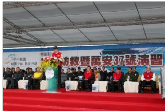
桃園縣演習總統致詞