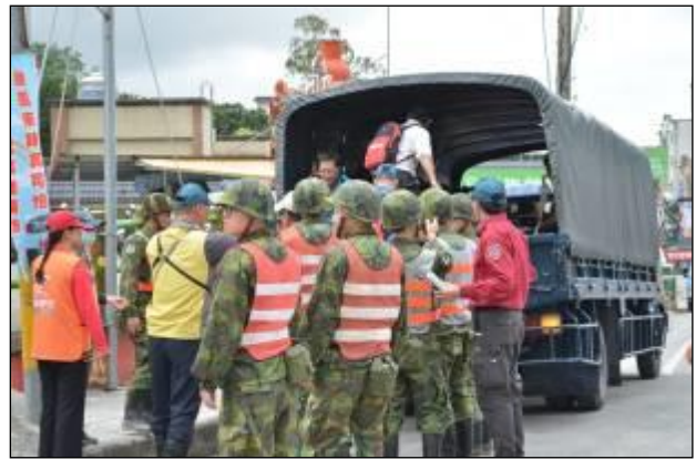
臺東縣疏散撤離演練