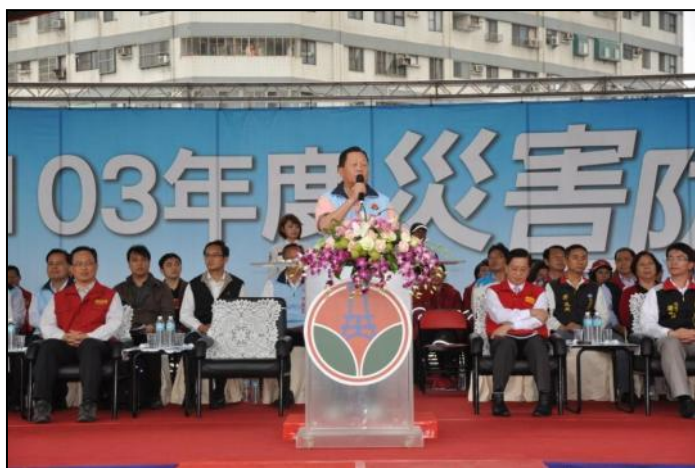
苗栗縣長演習致詞

苗栗縣政府於 103 年 4 月 3 日，假後龍鎮維真國中前廣場，辦理災害防救演習，苗栗縣劉縣長政鴻主持，內政部邱常務次長昌嶽及本辦公室周代理主任國祥擔任上級指導官，率中央各部會評核官等共同參加。模擬情境想定「象神」颱風來襲，中央氣象局發布超大豪雨特報，該縣多處地區有積淹水災情傳出，縣府人員及國軍共同協助通報，並實施緊急疏散撤離、收容安置。此次演習有新北市及彰化縣跨區支援。演習過程縣府動員參與演習人數計 500 人次，並動用車輛 69 輛、直昇機 2 架次，並邀請周邊地區民眾、村里鄰長及學校師生計 2,500 餘人到場觀摩，藉以提昇防災工作宣導成效。