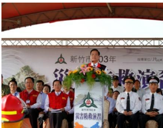
新竹市演習市長致詞

新竹市於 103 年 4 月 11 日假南寮漁港附近及磐石國中辦理「103 年度災害防救演習」。演習由市長許明財擔任指揮官，內政部常務次長邱昌嶽及本院災害防救辦公室代理主任周國祥擔任上級指導長官，率中央各部會評核官共同參加。演習想定強烈颱風侵襲新竹市，帶來超大豪雨，市府應變中心立即針對淹水災害潛勢地區進行疏散撤離、收容安置及各項救災演練。除以實地、實作的方式進行外，亦運用中央及鄰近之新北市、臺北市的救災資源進行跨區整合，並結合民間組織支援救災。本次演習除市府公務部門、各事業單位、民間救難團體、慈善志工及國軍部隊等 75 個單位共同實施外，亦結合在地樹下里、舊港里及東園里等居民實際參演，總計動員 742 人參與。