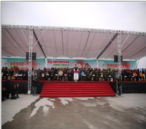
臺北市演習指揮官致詞

臺北市於 103 年 3 月 10 日假臺北市中山區大佳河濱公園、松山區民權國小等 2 場地辦理災害防救演習，臺北市政府市長郝龍斌親自主持，內政部政務次長蕭家淇及本辦公室參議王怡文擔任上級指導官，率中央各部會評核官共同參加。情境想定於 8 月 25 日 14 時，臺灣發生芮氏規模 7.3 強烈地震，震央位於花蓮外海，臺北市最大震度 5 級，演練項目包括市級與區級災害應變中心級開設應變、各式機具搶救、疏散撤離及收容安置等，並演練新北市、宜蘭縣、桃園縣、新竹縣及新竹市等跨區支援作業。演習過程市府動員參與演習人數計 4000 人次，並動用車輛 250 輛、直昇機 3 架次及船艇 12 架，並邀請周邊地區民眾、村里鄰長及學校師生計 360 餘人到場觀摩。