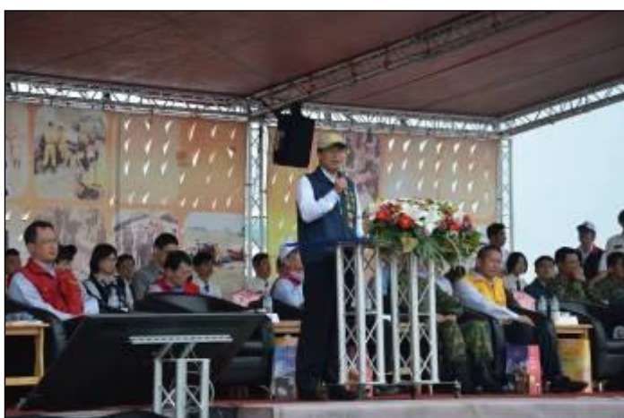
彰化縣演習縣長致詞

彰化縣政府於 103 年 3 月 31 日假高鐵彰化車站特定區辦理災害防救演習，演習由卓縣長伯源主持，行政院農業委員會胡副主委興華及本辦公室周代理主任國祥率中央各部會評核官共同參加。模擬情境想定彰化斷層發生芮氏規模 7.4，震源深度 7 公里之極淺層強烈地震，縣內多處地區震度 5-7 級，造成老舊建築物倒塌及人命傷亡等災情。演練內容包括綜合實作演練、收容安置演練，以及雲林縣、南投縣、臺中市、苗栗縣等參與跨區支援作業。演習過程縣府動員參與演習人數計 1,515 人次，並動用車輛 119 輛、直昇機 2 架次，並邀請周邊地區民眾、村里鄰長及學校師生計 270 餘人到場觀摩。