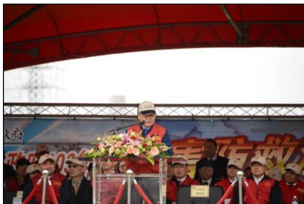
新北市演習副院長致詞

新北市於 103 年 3 月 21 日假新北市五股區二重疏洪道陽光運河、泰山堅實營區等 2 場地辦理災害防救演習，演習由新北市政府由朱市長立倫主持，行政院毛副院長治國親臨視察，內政部陳政務次長純敬、國防部六軍團指揮官王中將信龍、交通部陳政務次長建宇、行政院農委會陳副主任委員文德、行政院原能會蔡主任委員春鴻陪同，本辦公室周代理主任國祥率中央各部會評核官共同出席。演練情境想定模擬新北市境內發生淺層地震，造成房屋嚴重倒塌、道路橋梁損毀、維生管線中斷、火災事件頻傳及化學災變等複合式災害，演練市府各災害防救相關局處及志工團體應變處置過程，演習總計投入救災人員 2,000 人次及各式車輛(裝備)200 輛，飛行器 4 架次，並廣邀各級民意代表與中央駐地機關首長，與周邊地區民眾、村里鄰長及學校師生計 800 餘人到場觀摩。