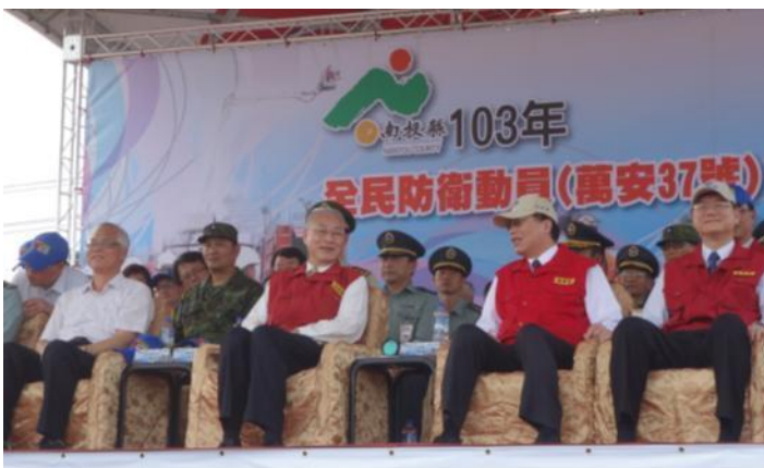
南投縣演習副總統蒞臨

南投縣於 103 年 4 月 22 日辦理 103 年災害防救暨萬安 37 號演習，上午於縣政府大樓進行兵棋推演，下午於名間鄉彰南路與大中路口舉行實作演練，演習由南投代理縣長陳志清擔任指揮官，副總統吳敦義親臨視察，內政部部长陳威仁及國防部副部長李翔宙、經濟部政務次長杜紫軍、交通部常務次長吳盟分、衛生福利部政務次長曾中明、行政院環境保護署副署長張子敬及行政院農業委員會副主任委員陳文德等陪同，由帶隊官陸軍常務次長趙中將克達會同，本院災害防救辦公室代理主任周國祥率各部會評核人員共同出席。演練情境想定彰化斷層發生芮氏規模 6.9 地震，震央位於南投縣中寮鄉，全縣 13 鄉鎮市均傳出災情，以名間鄉災情最為慘重，演練震後引發土石崩塌及火災、瓦斯及自來水幹管破裂、電信及道路橋梁中斷等災情處置。此次演習縣府共動員 800 人次、各式救災車輛機具 165 車次、飛行器 4 架次，並邀請周邊地區民眾 800 餘人到場觀摩。