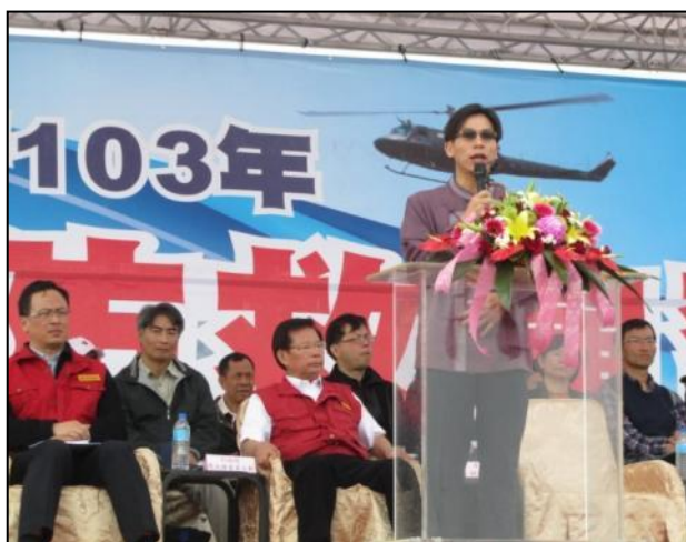
屏東縣演習指揮官致詞

屏東縣於103年3月10日假新園鄉鹽埔漁港辦理「103年度災害防救演習」。演習由副縣長鍾佳濱擔任指揮官，本院政務委員簡太郎率本院災害防救辦公室代理主任周國祥，以及中央各部會評核官共同參加。演練情境想定台灣西南部外海發生大地震後引發海嘯，造成沿海地區複合式災情之應變處置，並演練海巡署等中央部會及高雄市、臺南市、嘉義縣等縣市政府跨區支援救災。演習除縣府公務部門、各事業單位、民間救難團體、慈善志工及國軍部隊等共同實施外，亦結合在地新園鄉公所及共和村、鹽埔村村民實際參演，約動員500人參與。