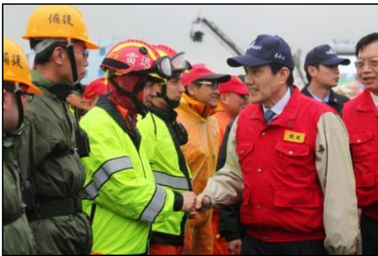
總統蒞臨桃園縣演習會場

桃園縣於 103 年 3 月 6 日辦理 103 年災害防救暨萬安 37 號演習，上午於消防局進行兵棋推演，下午於中路重劃區內防災公園舉行實作演練，演習由桃園縣長吳志揚擔任指揮官，總統馬英九親臨視察，內政部部长陳威仁及環保署署長魏國彥陪同，由帶隊官國防部副部長李翔宙上將會同，本院災害防救辦公室代理主任周國祥率各部會評核人員共同出席。演練情境想定湖口斷層發生芮氏規模 7.3 地震，桃園縣震度 6 級，演練震後引發火災、瓦斯及自來水幹管破裂、電信中斷、台鐵列車出軌及化學品洩漏等災情處置。演習縣府共動員 2000 人次、各式救災車輛機具 370 車次，並邀請周邊地區民眾 1000 餘人到場觀摩。