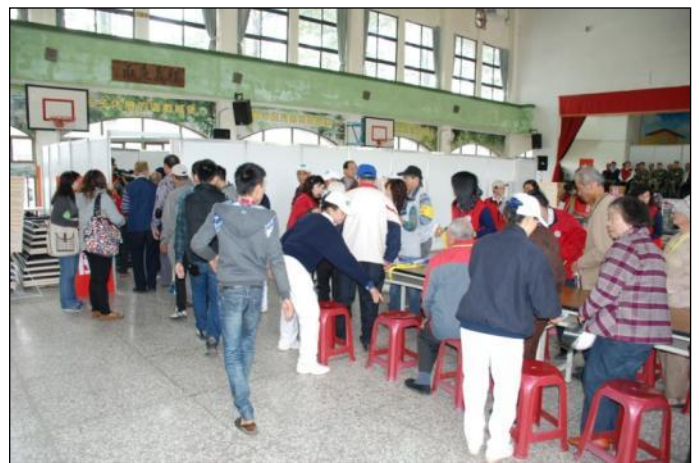
宜蘭縣收容安置演練