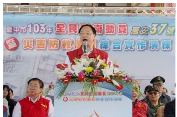
臺中市演習實兵演練