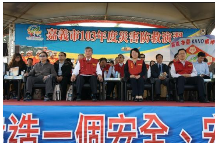
嘉義市演習實兵演練